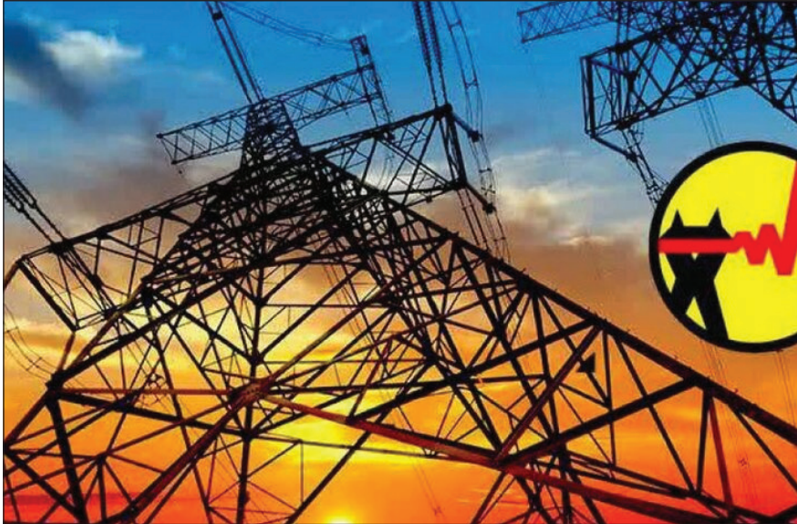
رو به رو بودیم. اما امسال با اجرای طرح‌های مدیریت مصرف برق خانگی و طرح سراسری پاداش صرفه‌جویی در پیک تابستان این عدد به حدود ۳۰۰ مگاوات رسیده است.

مدیرکل دفتر مدیریت انرژی و امور مشتریان شرکت توانیر خاطرنشان کرد: بر اساس آمار، هر ساله مشترکانی هستند که از پله‌های پرمصرف به سمت کم مصرف مهاجرت می‌کنند.